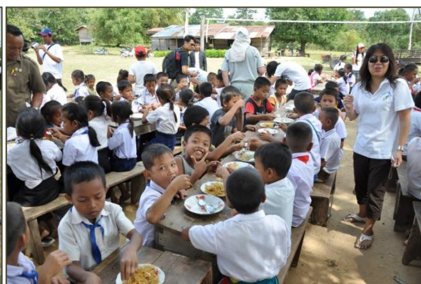
Jeux et repas avec les enfants