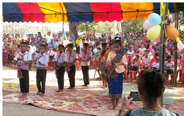
Inauguration des écoles

Un autre volet de notre action consiste à apporter une aide médicale régulière dans ces villages, grâce à des médecins et dentistes français bénévoles. Sur place, nous travaillons également en collaboration avec des équipes médicales locales.