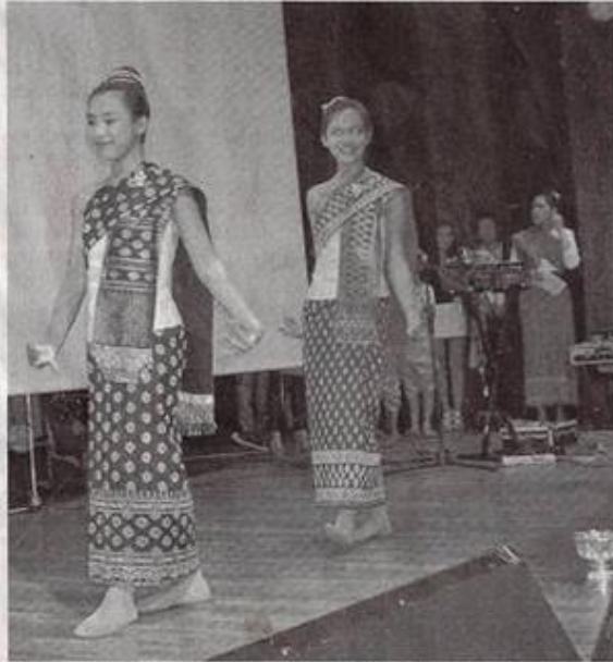
Jolies demoiselles en costumes laotiens.

L'association a déjà construit plusieurs écoles primaires, dont la dernière vient d'être inaugurée en février : les 19 classes accueillent plus de 600