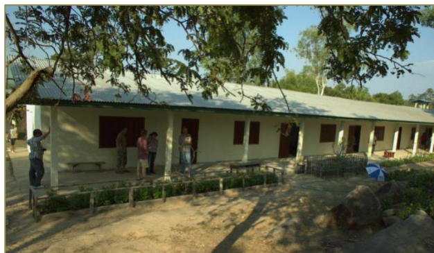
École avant et après rénovation