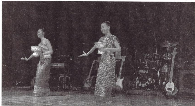
Un spectacle de danses était prévu au programme.